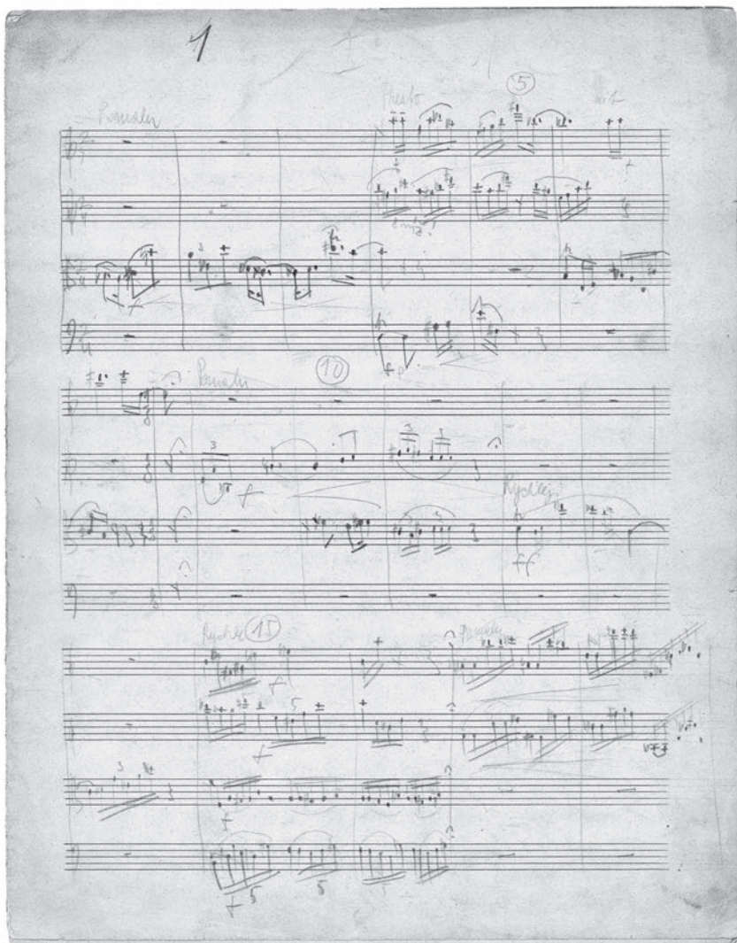
Začátek Čtyř vět pro smyčcové kvarteto, 1938 (rukopis).