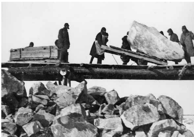
Práce vězňů gulagu (30. léta 20. století)